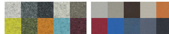
Divina Melange 2 fabric by Kvadrat © (23 colors)