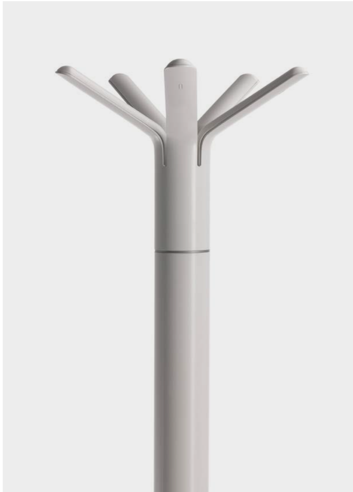
Mobles 114 | Complements